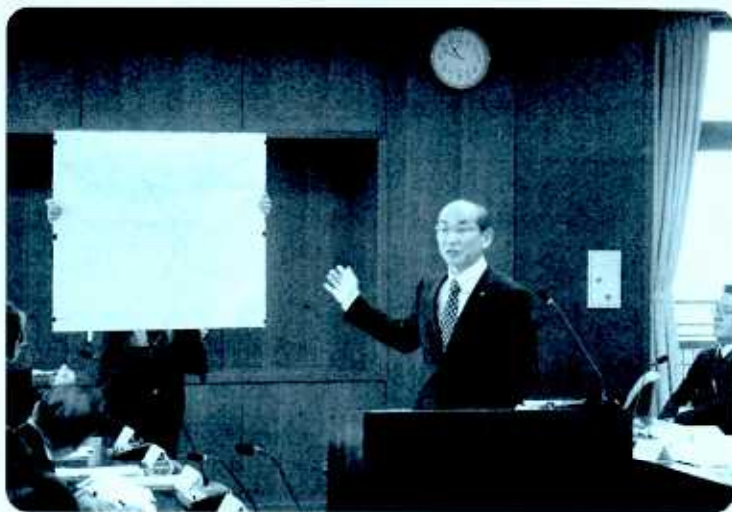
3月定例会 予算特別委員会で旧町部の現状を訴える

建設部次長 将来を見据えた「無雪害街づくり計画」を作成する。消雪装置か機械除雪のどちらが有利か検討し、新規の消融雪施設整備の事業方針を決めたい。